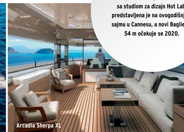
Arcadia Sherpa XL