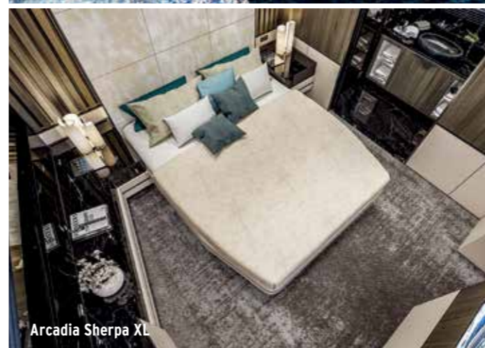
Arcadia Sherpa XL