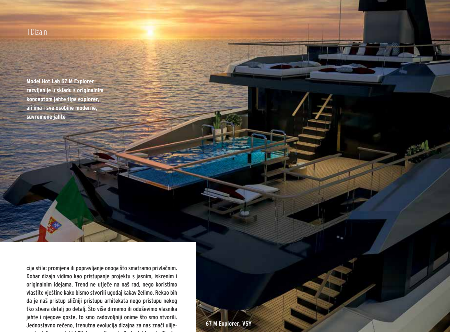
67 M Explorer, VSY

Model Hot Lab 67 M Explorer razvijen je u skladu s originalnim konceptom jahte tipa explorer, ali ima i sve osobine moderne, suvremene jahte