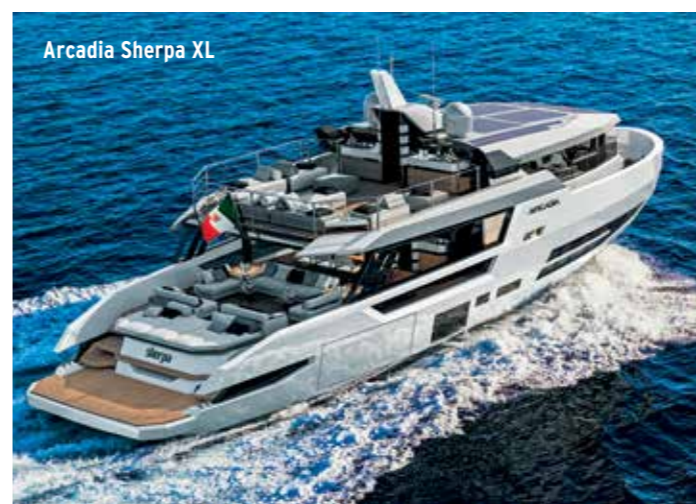
Arcadia Sherpa XL

Prva jahta novog koncepta Sherpa XL, razvijena u suradnji sa studiom za dizajn Hot Lab, predstavljena je na ovogodišnjem sajmu u Cannesu, a novi Baglietto 54 m očekuje se 2020.