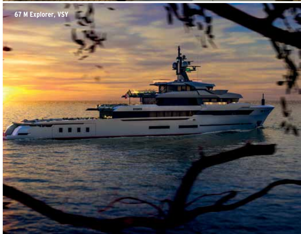
67 M Explorer, VSY

Prva jahta novog koncepta Sherpa XL, razvijena u suradnji sa studiom za dizajn Hot Lab, predstavljena je na ovogodišnjem sajmu u Cannesu, a novi Baglietto 54 m očekuje se 2020.