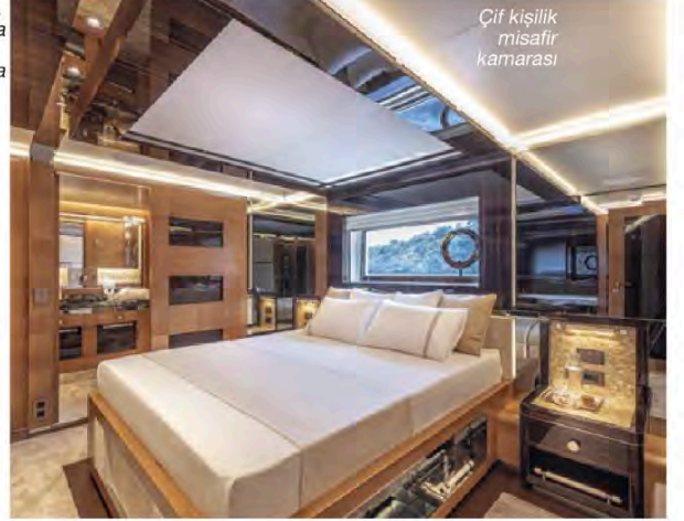
Çift kişilik misafir kamarası