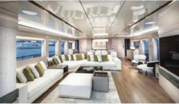
GENİŞ VE AYDINLIK

T üm Numarine 32 XP keşif yatlarında olduğu gibi bu yeni tekne de verimli deplasman gövdeye sahip. Gövde tekneye azami 14 knot sürat sağlıyor. Seyir sürati 12 knot ve 8kt süratte 4 bin deniz mili gibi heyecan verici bir menzile sahip. Geniş ve havadar ana salonu, üst güvertede tekne sahibine özel alan, ana güvertede bir VIP süiti ve dört ekstra misafir kamarası özellikleriyle klasik 32 XP özelliklerine sahip olan bu