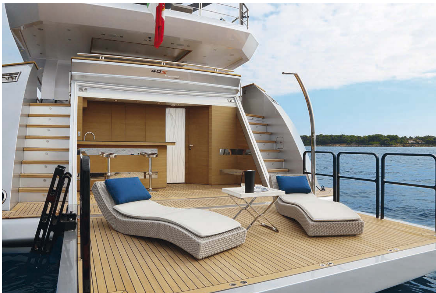
COLUMBUS SPORT 40S HYBRID

accède directement à la cuisine principale équipée de marques réputées comme Gaggenau et Miele. Enfin, la partie avant du "main deck" a été conçue pour l'armateur et sa femme et uniquement pour eux, avec tout d'abord une suite aux dimensions raisonnables décorée avec des matériaux très clairs et éclairés par des gros hublots rectangulaires latéraux, mais point de vue panoramique sur 200 degrés par exemple, comme c'est le cas sur d'autres unités. Les propriétaires ont à leur disposition une salle de bain généreuse en volume et de très belle facture, l'espace pour madame comprenant une baignoire. Il est séparé de celui réservé à monsieur par une douche indépendante aux des parois de verre et deux pommeaux dits de pluie encastrés dans le plafond. Le vaste dressing est quant à lui commun. L'antichambre de cette suite fait office de bureau et de coin lecture avec un petit sofa en L. Le hard-top du Columbus 40S Hybrid protège une zone de détente, un salon où règne une symétrie qui pour certains symbolise tout à fait l'ambiance zen, à fortiori avec une décoration minimaliste qui peut très bien s'enrichir de quelques objets. Ce salon avec