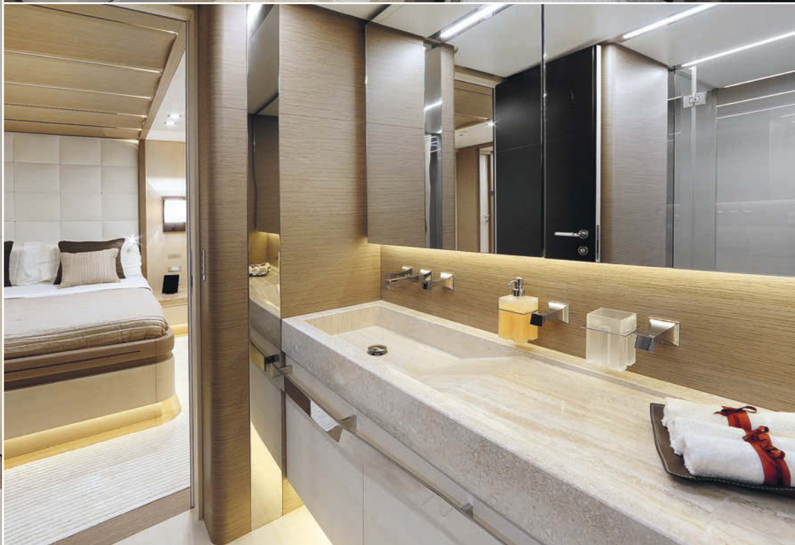
COLUMBUS SPORT 40S HYBRID

toujours à l'extérieur, cap sur la poupe qui n'est pas en reste en matière de confort puisqu'elle a été aménagée en beach club grâce au tableau arrière qui s'abaisse et augmente alors la surface "plaisir" avec en sus un bar, une douche et des toilettes de jour. Contiguë à la cloison du beach club, le garage, qui s'ouvre latéralement sur bâbord, contient le tender, un semi-rigide Novurania de 5 mètres de long. Il possède un atelier également sur tribord. Vient ensuite en toute logique la salle des machines qui regorge d'équipements, à commencer par les deux MTU de 1920 ch mariés