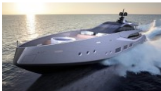
Il superyacht aerodinamico