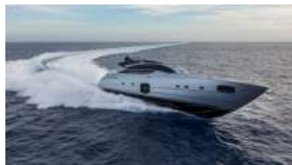
Pershing 82, freccia da 45 nodi