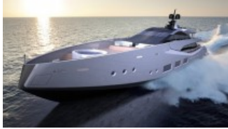
Il superyacht aerodinamico