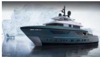
I superyacht di Sanlorenzo