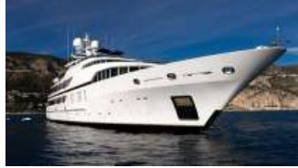
Seaylon, lo yacht sensuale