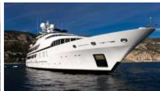
Seaylon, lo yacht sensuale