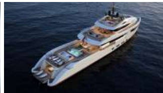
Il megayacht "double face"