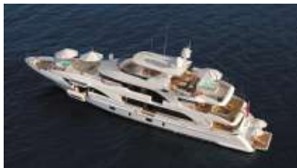
Il nuovo 40 metri di Benetti