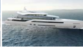
I 27 superyacht di Benetti