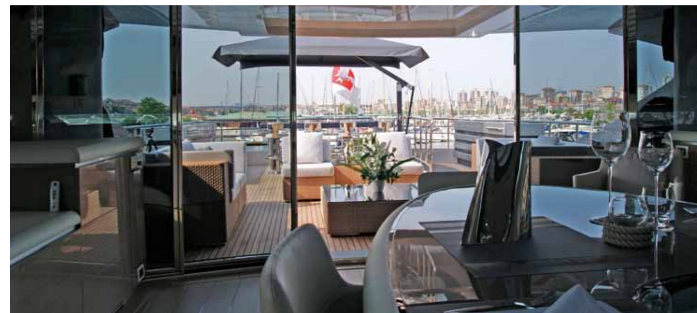
Motor Yacht Noor, Bilgin Yachts (Istanbul), giugno 2010 - interior design by Hot Lab Yacht & Design