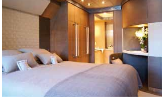
Ana kamarada çift kişilik yerine, tek kişilik iki büyük yatak tercih edilmiş (üstte). Ana kamaranın ayrı duş ve küvete sahip banyosu (en solda). VIP kamara (solda).

Koyu ve açık renkleri birbirinden farklı mekânlarda kullanılan Hot Lab, renk paletini oluşturmak için çıkış noktası olarak bir resim belirlediğini söylüyor. Mesela Noor'da "karanlık ve aydınlık" temalarından yola çıkmışlar. Dolayısıyla pastel renklerle birlikte çikolata renklerine de yer vermişler. Salonda seçkin ve şık bir görünüm vermeye çalışırken, dinlenme alanlarında renklerin yormaması ve rahatlatması için krem tonlarını tercih etmişler.